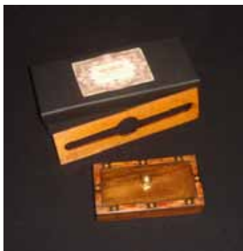
La Moneta liquefatta

Il sogno e la sfida, sono quelli di realizzare oggetti esclusivi e raffinati partendo dal recupero delle proprie tradizioni italiane e napoletane in particolare e dalla comune passione per la magia. Per questo i giochi sono ispirati agli stili che hanno caratterizzato il periodo a cavallo tra il 1700 ed il 1800 napoletano come il Luigi XVI che prese piede in tutta Europa a partire dalla seconda metà del 1700 ed ebbe grandissima influenza in Italia in particolare a Napoli, si pensi ad esempio ai famosissimi Presepi conosciuti in tutto il mondo o come il Secondo Impero sviluppatosi anch'esso in Francia durante il regno di Napoleone III (1848/1870)