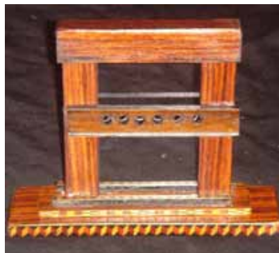
La Fuga di Casanova