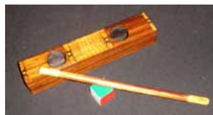
L'Antro della Sibilia