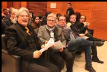
Ala sinistra della Giuria