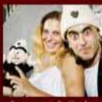
Lannutti & Corbo